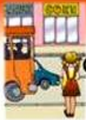
Как безопасно отидете училище?