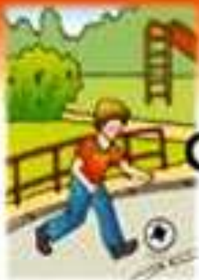
Тук играваме играта?