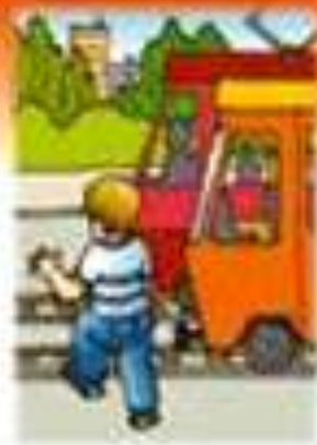
Как безопасно отидете училище?