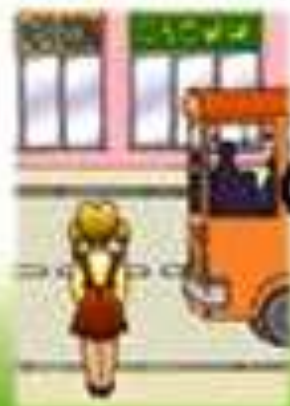
Как безопасно отидете училище?