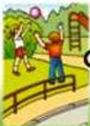
Тук играваме играта?