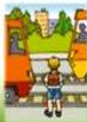
Как безопасно отидете училище?