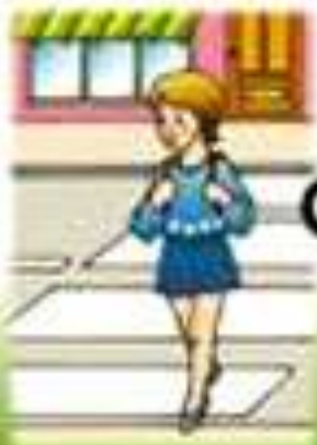
Как безопасно преминава улицата?