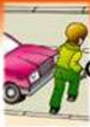
Как безопасно преминава улицата?