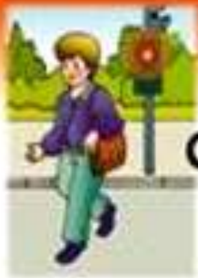
Къде излезем безопасно от училище?