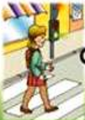
Къде излезем безопасно от училище?